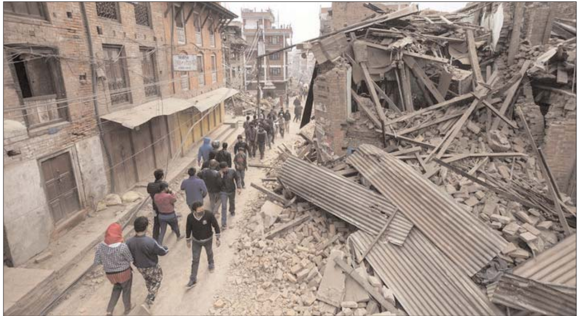
(Airbus 320-200, рейс QZ8501) произошли, когда скачок сейсмичности в эти дни достиг почти 100 землетрясений.

Не вызывает никаких сомнений, что в мире ежегодно немало число больших и малых нарушений режимов полетов и даже аварий могут быть следствиями вышеуказанных эффектов. Ранее мы провели сопоставление сейсмичности и авиационных аварий за 30-35 лет и корреляция оказалась почти полной. Но после 2000 года статистики нет, ее не публикуют. Хотя, в связи с постоянным ухудшением экологической ситуации, – ростом напряженного состояния среды, – количество сбоев будет неотвратно увеличиваться. По странному стечению обстоятельств аварии малазийских самолетов 8-го марта 2014 года (Боинг 777-200, рейс MH370) и 28 декабря 2014 года